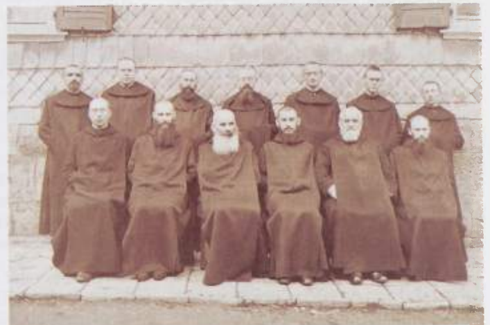
Benediktinerkonvent Meschede am 4. April 1929