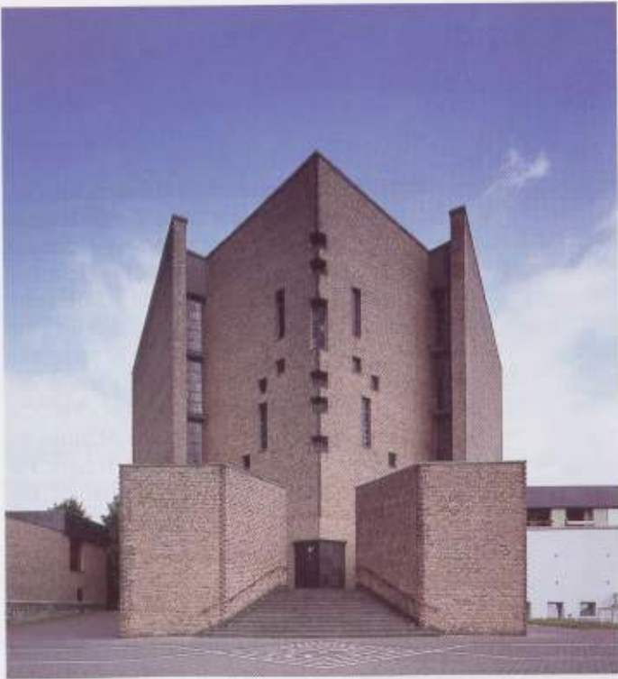
Ansicht des Klosters