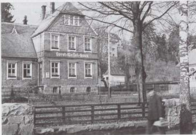
Das erste Domizil der Benediktinermonche in der Steinstraße 28. Später war darin die Kreisleitung der NSDAP – Horst-Wessel-Haus – stationiert.

Alles freute sich über die Verbesserung, insbesondere der neue Gottesdienstraum wurde von Kloster und Öffentlichkeit als großer Fortschritt empfunden. In der Klosterchronik von Kö-